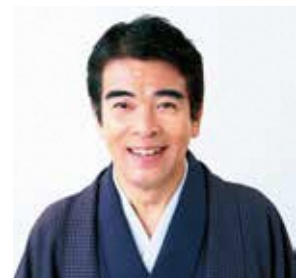
さんゆうていうたのすけ 三遊亭歌之介

14:00 開場 14:30~ 岐阜県介護人材育成 事業者認定制度 認定証授与式 15:15~ 記念落語会 落語家 三遊亭 歌之介